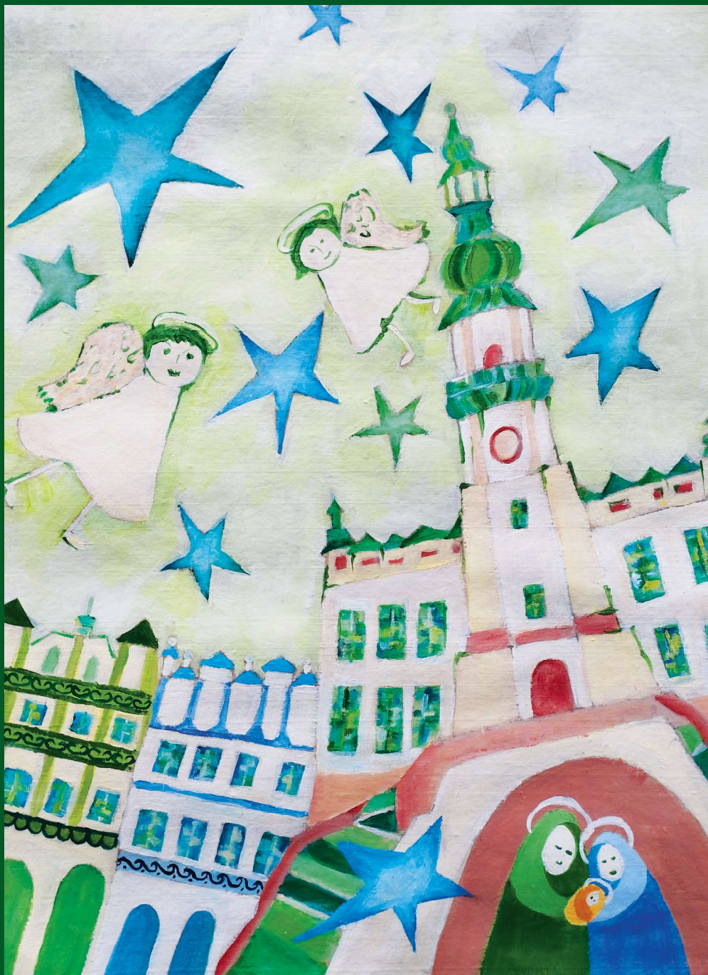
Gabriela Łoza lat 13, Koło Plastyczne ODK Okraglak

BIULETYN INFORMACYJNY SPÓŁDZIELNI MIESZKANIOWEJ IM. JANA ZAMOYSKIEGO 18 GRUDNIA 2023 (111) kwartalnik *ISSN 1509-1368* nakład 4000 egz.