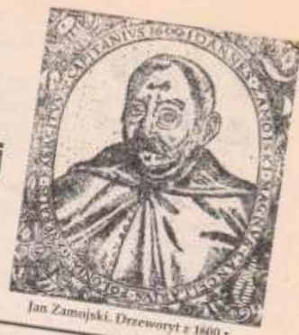
Jan Zamojski. Drewnoryt z 1600 r.

Rok 1 Nr 1/99 (dwumiesięcznik) 15 x 1999